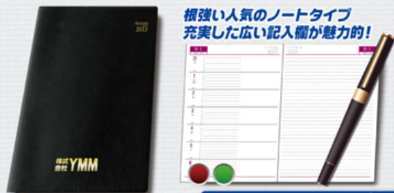
根強い人気のノートタイプ 充実した広い記入欄が魅力的!