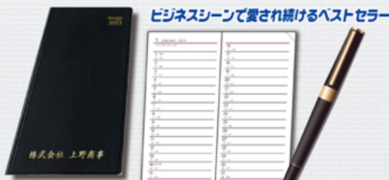
ビジネスシーンで愛され続けるベストセラー