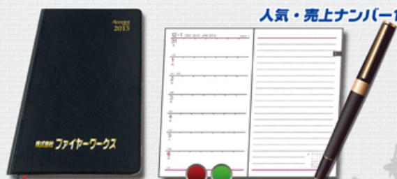
人気・売上ナンバー1